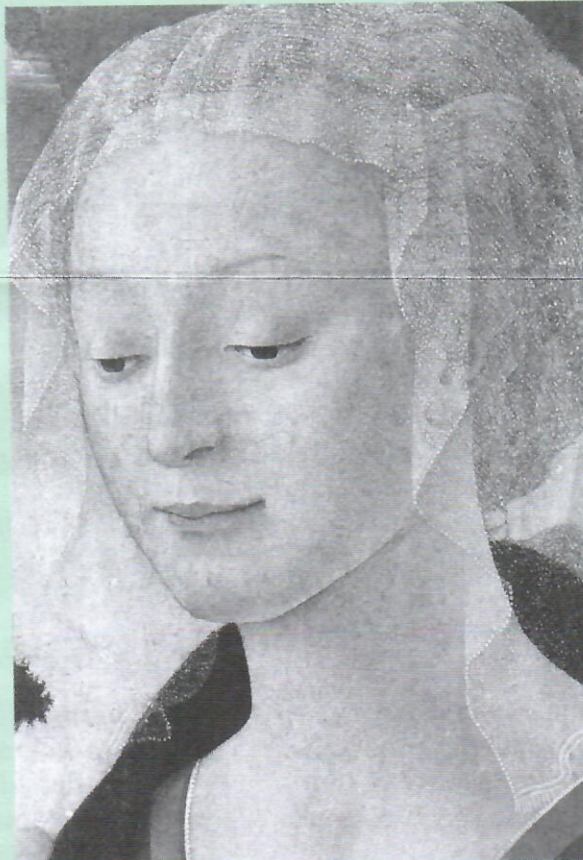
Peinture sur bois d'Alessio Baldovinetti (1425-1499) - Musée du Louvre.

Elle a pensé, comme les Apôtres, que tout était fini, que tout était perdu. Mais elle a bondi de joie, lorsque comme eux, elle fit l'expérience qu'il était vivant au-delà de la mort et que désormais, pour elle et pour l'humanité tout entière, la vie serait plus forte que la mort.