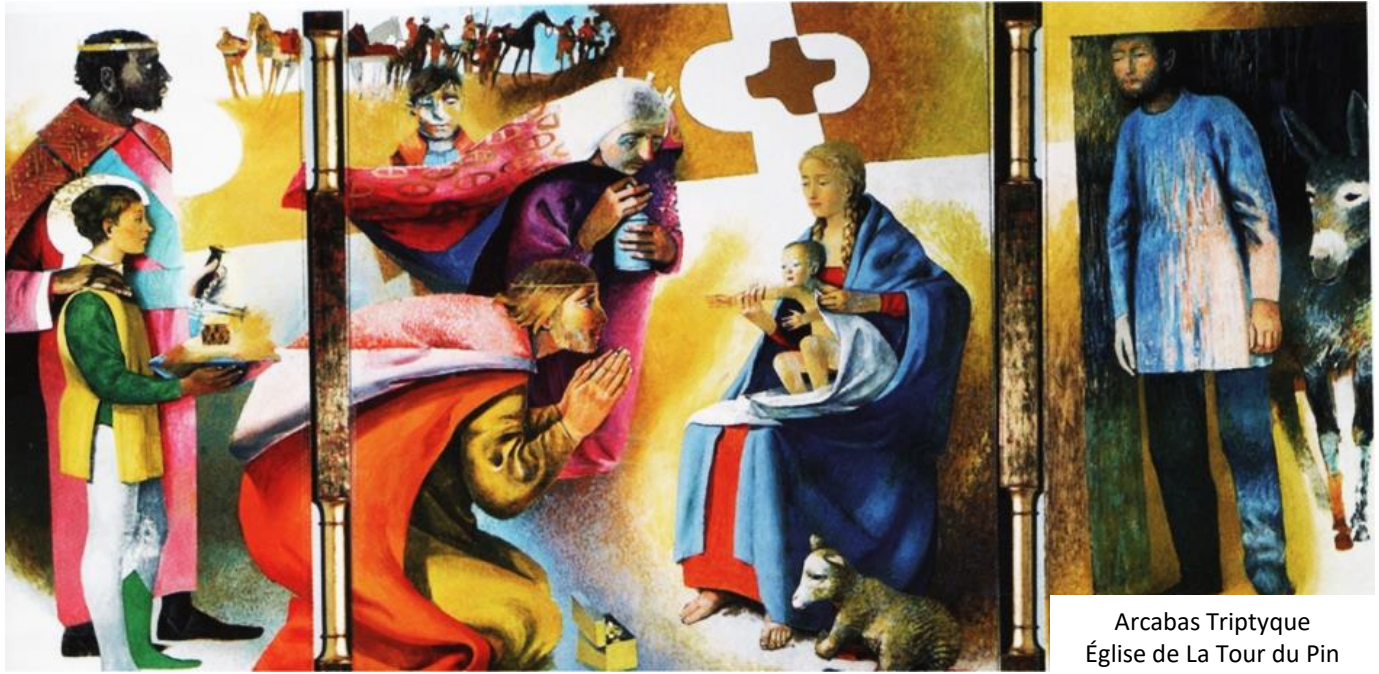
Arcabas Triptyque Église de La Tour du Pin